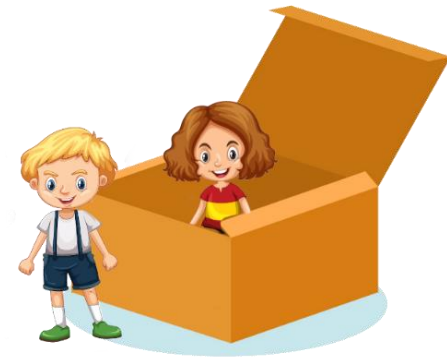
⑤ そと 外 = out ⑥ なか 中 = in