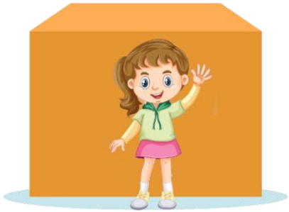
① まえ 前 = front