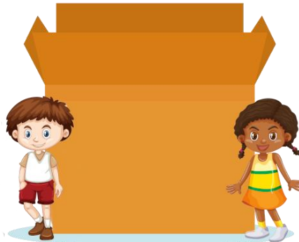
⑦ みぎ 右 = right ⑧ ひだり 左 = left ⑨ あいだ 間 = between