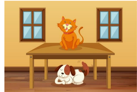
③ した 下 = under ④ うえ 上 = on