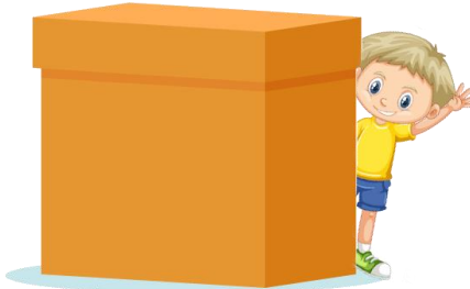
② うし 後ろ = behind